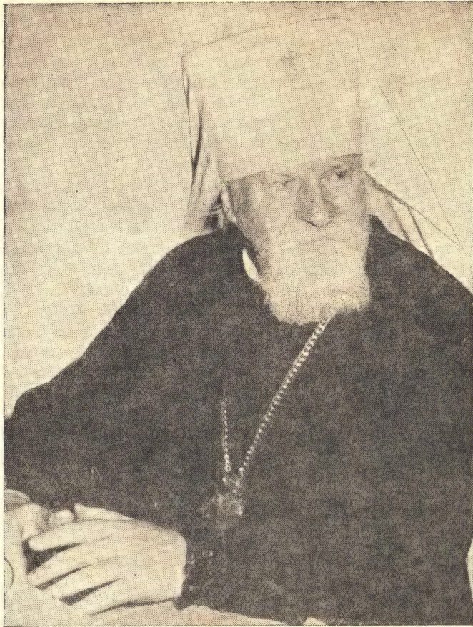
Митрополит Николай на своем рабочем месте в дни заседаний Венской сессии Всемирного Совета Мира